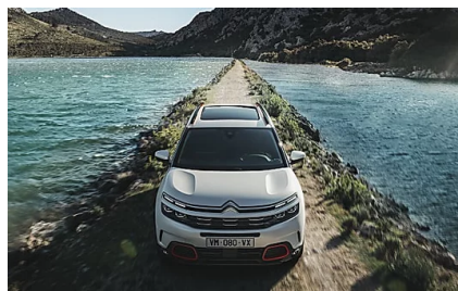
Nuovo SUV Citroën C5 Aircross in 30 combinazioni colore. Scoprillo anche domenica. (Citroën Italia)