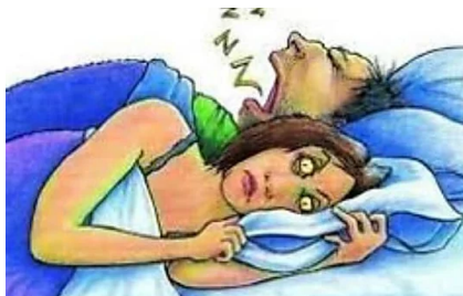
Smettere di russare: ecco un rimedio pratico e veloce (anche per apnee notturne) (oggiBenessere.com)